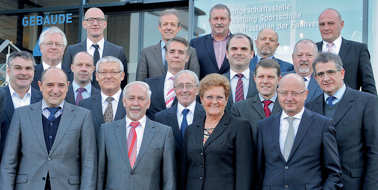
Die Gründungsversammlung der Sportstiftung Saar 2014.