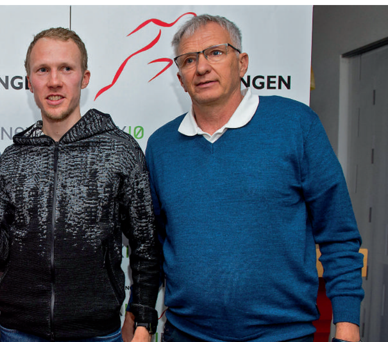
rd Ringer, offiziell beim LC Rehlingen vorgestellt. Sehr zur Freude der Vereinsver-

Der 3.000-Meter-Europameister von 2014 und 2015 und mehrfache Deutsche Meister zählt seine Teilnahme an den Olympischen Spielen 2016 in Rio de Janeiro zu seinen wichtigsten Erfolgen als Sportler: „Es ist schon ein tolles Gefühl, im Nationaltrikot zu laufen und es dann auch noch auf das Podest zu schaffen“, sagt Ringer. „Aber als ich meinen Namen auf der Nominierungsliste für die Olympischen Spiele lesen durfte, ging ein Traum in Erfüllung, den ich schon seit Kindheitstagen verfolgt hatte.“ Dieses Gefühl will er ein zweites Mal erleben – und zwar vor den Olympischen Spielen in Tokio 2020. Wobei aus dem Kindheitstraum fast schon „normales“ Ziel geworden ist. „Träume habe ich aber immer noch“, lenkt Ringer ein: „Zum Beispiel eine Platzierung unter den besten Acht bei Olympia. Dafür muss aber wirklich alles passen“, sagt er mit Blick auf die nahezu unerreichbare Konkurrenz aus Afrika. Trotzdem: Vor drei Jahren hat sich schon einmal einer seiner schier unerreichbaren Träume erfüllt. Wieso soll dies nicht noch einmal klappen?