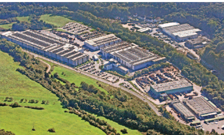
Das Unternehmen am Standort Schmelz-Limbach.

Darüber hinaus ist sich das Unternehmen auch seiner gesellschaftlichen und sozialpolitischen Verantwortung durchaus bewusst. Als Gründungsmitglied der „Sportstiftung Saar“ möchte die Geschäftsführung der Gebr. Meiser GmbH die Förderung junger Talente und saarländischer Spitzensportler auf einem sehr hohen Niveau unterstützen und somit auch einen wichtigen Beitrag für die Region leisten.