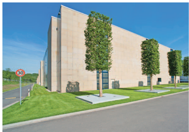
Gebäude der Verzinkerei und des Logistikzentrums am Standort Schmelz-Limbach.

Rund 2.800 Mitarbeiter sind heute für das saarländische Familienunternehmen tätig, davon arbeiten 1.500 an den beiden deutschen Standorten in Schmelz-Limbach und im sächsischen Oelsnitz. Produktionsstandorte in Frankreich, Belgien, Brasilien, Ungarn, Ägypten, Marokko, der Türkei und in den Vereinigten Arabischen Emiraten sowie eine Vielzahl von Vertretungen und Niederlassungen in 27 Ländern, ermöglichen stets eine persönliche und zuverlässige Betreuung von der Planung bis zur Realisation großer und kleiner Kundenprojekte.