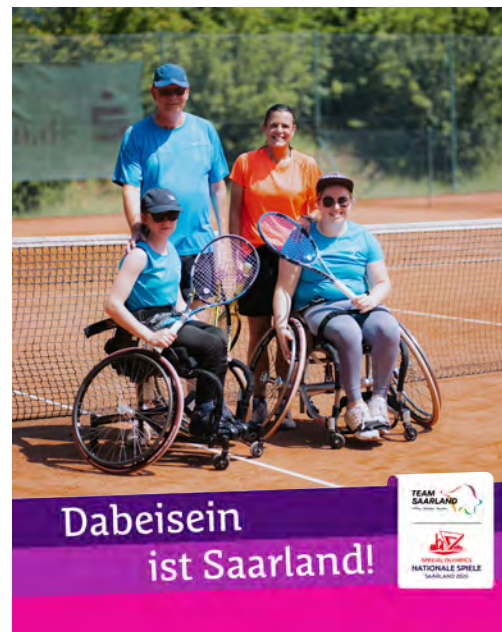
Social Media Vorlage anhand Beispielmotiv angelegtes Format: B 1080 x H 1350 px