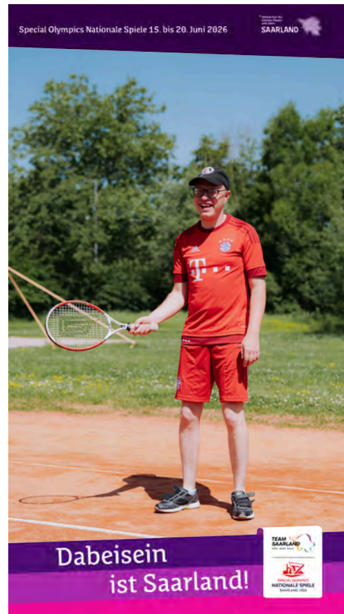
Social Media Vorlage anhand Beispielmotiv angelegtes Format: B 1080 x H 1920 px