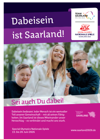
Anzeige viertel Seite angelegtes Endformat: B 105 x H 148,5 mm