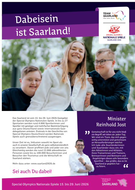
Anzeige ganze Seite angelegtes Endformat: B 210 x H 297 mm