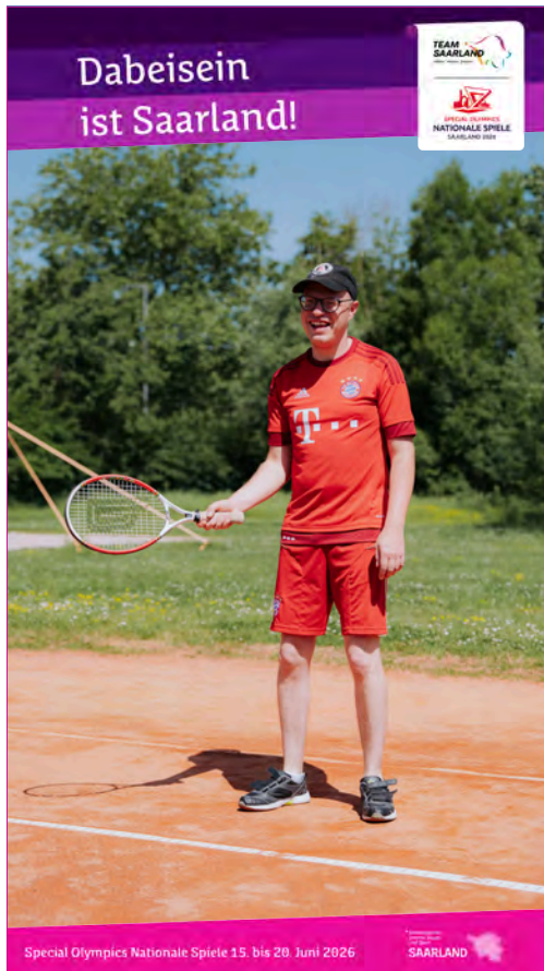
Social Media Vorlage anhand Beispielmotiv angelegtes Format: B 1080 x H 1920 px