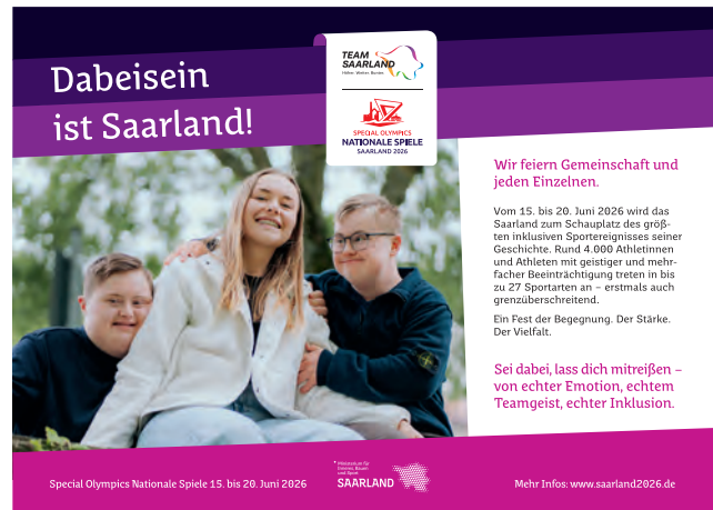
Anzeige halbe Seite angelegtes Endformat: B 210 x H 148,5 mm