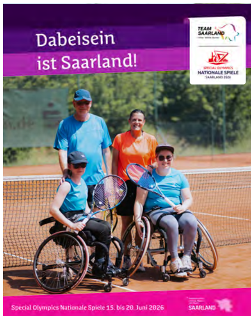
Social Media Vorlage anhand Beispielmotiv angelegtes Format: B 1080 x H 1350 px