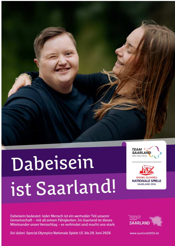
Plakat angelegtes Endformat: DIN A3 (B 297 x H 420 mm)